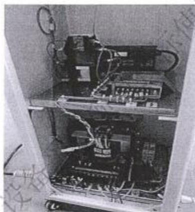
图 26 内部电路 4